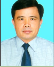
Ông Huỳnh Thanh Điền Phó Chủ tịch Ủy ban nhân dân tỉnh Nghệ An