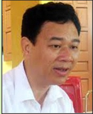
Ông Vũ Văn Cài Phó Chủ tịch Ủy ban nhân dân thành phố Lào Cai tỉnh Lào Cai